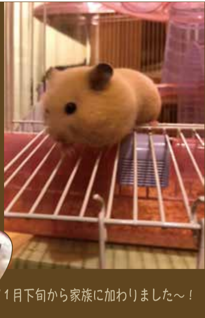
11月下旬から家族に加わりました～!

9月生まれのメス、キングマハムスター。名前はマミュ。この子で3代目のハムスターなんだ。今まで飼っていたゴールデンハムスターと違い、警戒心が強く、慣れるまで2～3週間は掛かるんだって、「長いな、ハア、」でも諦めません!毎日新鮮なエサと水を交換し、小屋もいつも清潔で健康に暮らしていけるように、お互いスキンシップしながら根気強く慣れることを信じて待ちます!お正月までには、手のひらに乗ってエサを食べてくれるのが目標です。仕事も目標に向かって精進して参りますので自分とマミュを宜しくお願いします。(菅)