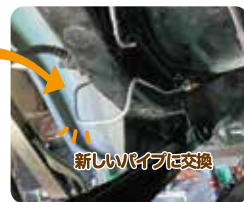
新しいパイプに交換

その後の漏れ点検、配管への空気混入がないか、ブレーキの利き具合(制動力)等々を検査し愛着のあるお車を復帰することが出来ました。(※すべての車両が対応出来るものではありません。気になる方はご相談ください) この話が3台続けて舞い込んだ時にはビックリしましたが、いずれも無事にお客様の元へお届けすることが出来ました。でも、定期的に点検して頂く事をお願いしております。修理が出来る範囲であれば、何とか復帰はできますが、全てがうまく行く訳でもありません。是非、気になる点がございましたら気軽に弊社スタッフまでお声を掛けてみてください。これからも(ボヤキとはちがうかな)宜しくお願いいたします。(三澤) 社長のぼやき???