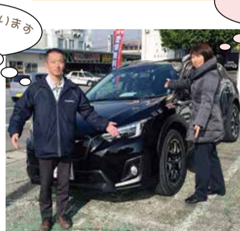
お客様の車の前にて