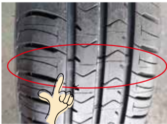
夏タイヤ: スリップライン

スタッドレスタイヤには、プラットホームというマークが付いています。スタッドレスタイヤが減り、マークが出てくるとスタッドレスタイヤの交換目安です。