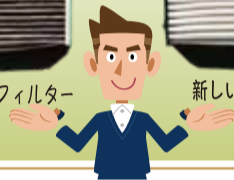
新しいエアコンフィルター

お勧めします。また、シーズン前にエアコンの洗浄をすると、汚れとともに臭いも取れ、エアコンの風が気持ち良く感じられると思います。さあ、快適な車でドライブを楽しんではいかがでしょうか。(小野)