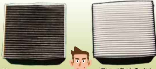
汚れているエアコンフィルター